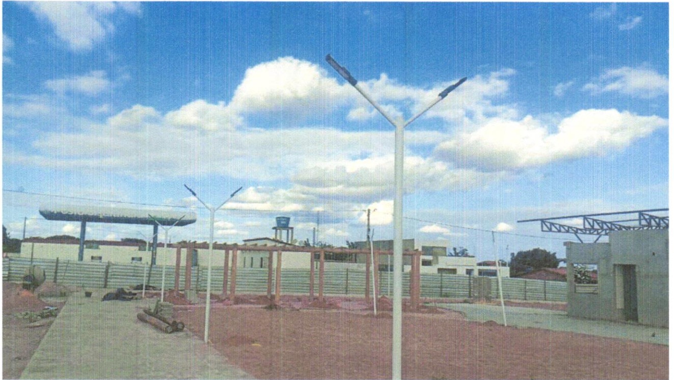
FOTO 10 - POSTE DE AÇO CONICO CONTÍNUO , ENGASTADO, COM QUATRO PÉTULAS