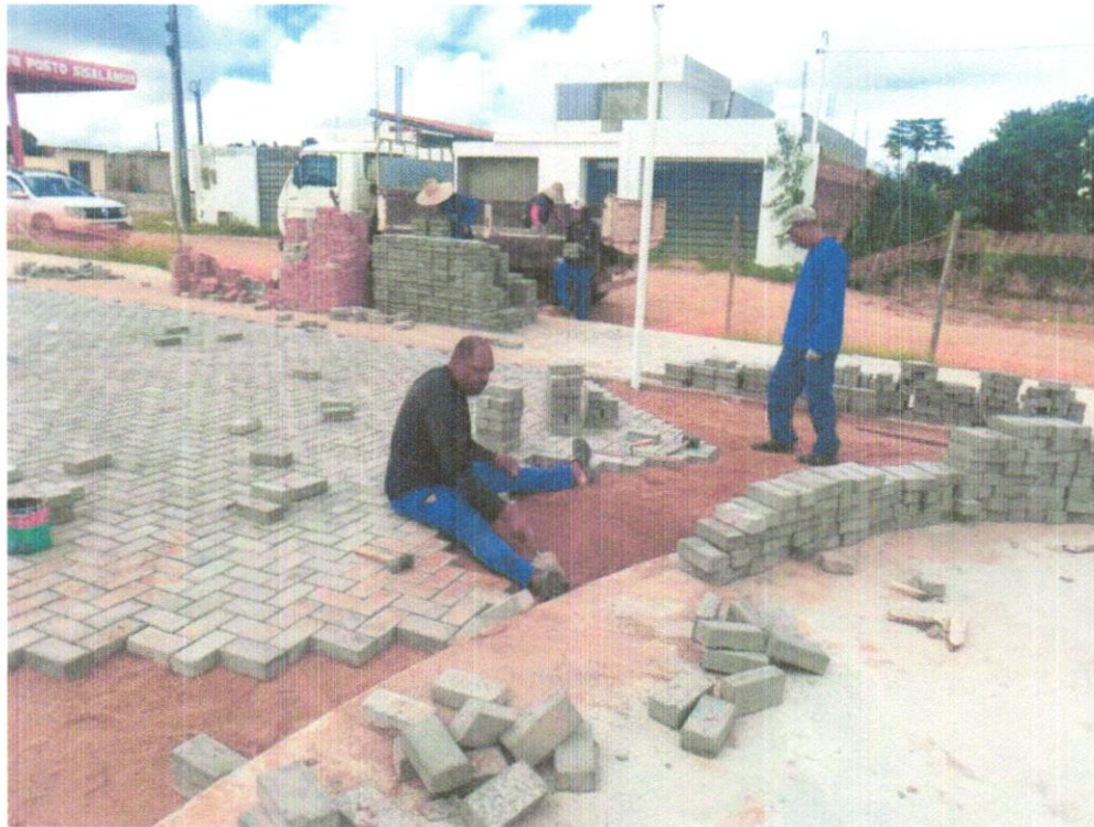
FOTO 04 - EXECUÇÃO DE PÁTIO/ESTACIONAMENTO EM PISO INTERTRAVADO, COM BLOCO RETANGULAR COR NATURAL DE 20 X 10 CM, ESPESSURA 6 CM.