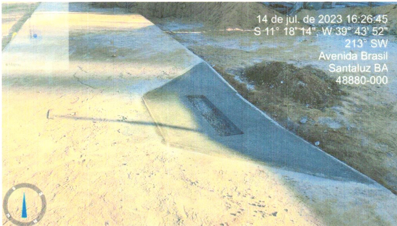
FOTO 12 - Rampa padrão para acesso de deficientes a passeio público, em concreto simples Fck=25MPa