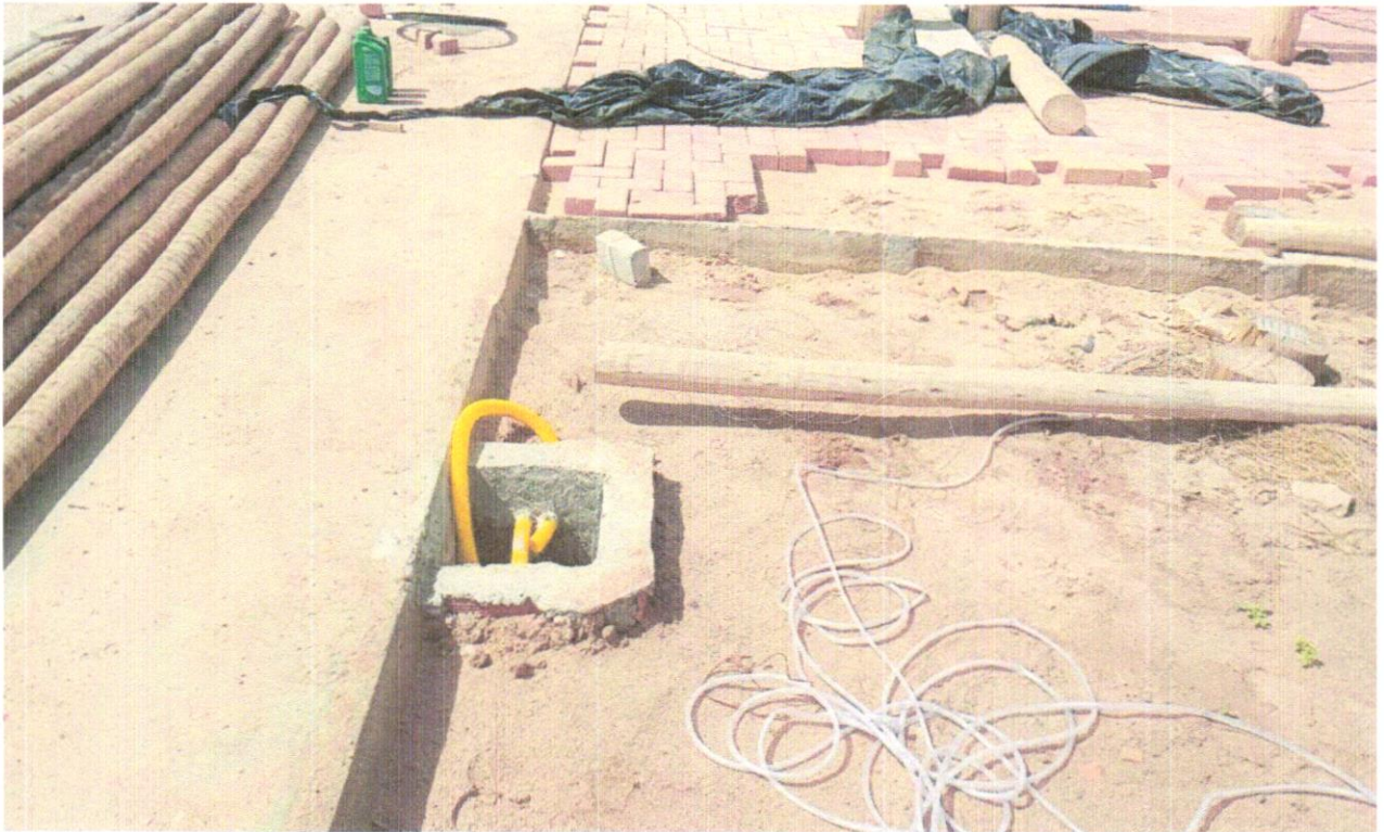
FOTO 14 - Caixa de passagem em alvenaria de tijolos maciços esp. = 0,12m, dim. int. = 0,30 x 0,30 x 0,30m