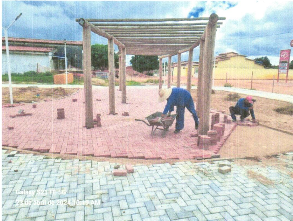
FOTO 06 - EXECUÇÃO DE PÁTIO/ESTACIONAMENTO EM PISO INTERTRAVADO, COM BLOCO RETANGULAR COLORIDO DE 20 X 10 CM, ESPESSURA 6 CM.