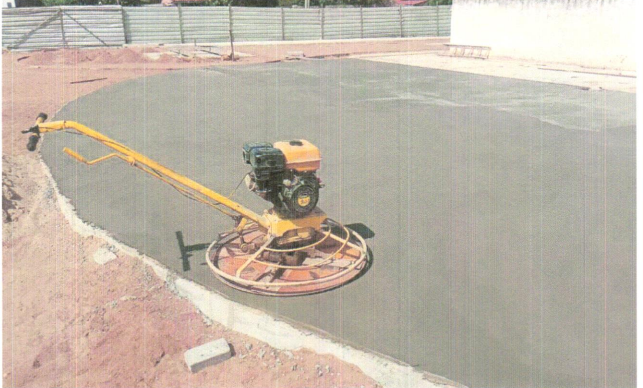
FOTO 18 - CONCRETO SIMPLES FABRICADO NA OBRA, LANÇADO E ADENSADO