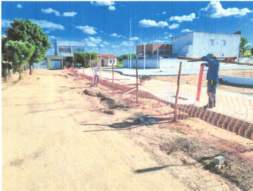
FOTO 02 - Tapume de proteção em tela de polietileno h=1,20 com bloco de concreto