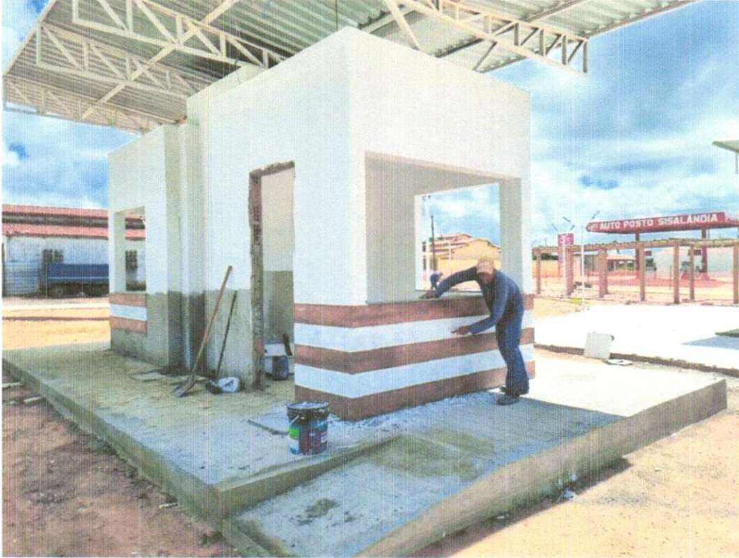
FOTO 08 - APLICAÇÃO E LIXAMENTO DE MASSA LÁTEX EM PAREDES, UMA DEMÃO.