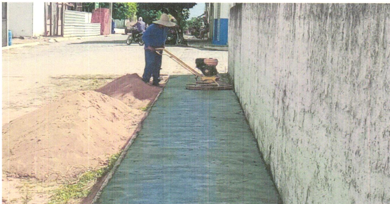
FOTO 20 – CONTRAPISO EM ARGAMASSA TRAÇO 1:4 (CIMENTO E AREIA), PREPARO MANUAL, APLICADO EM ÁREAS SECAS SOBRE LAJE, ADERIDO, ACABAMENTO NÃO REFORÇADO.

FOTO 19 – CONTRAPISO EM ARGAMASSA TRAÇO 1:4 (CIMENTO E AREIA), PREPARO MANUAL, APLICADO EM ÁREAS SECAS SOBRE LAJE, ADERIDO, ACABAMENTO NÃO REFORÇADO.